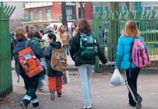
Caro scuola L'amministrazione regala 400 kit