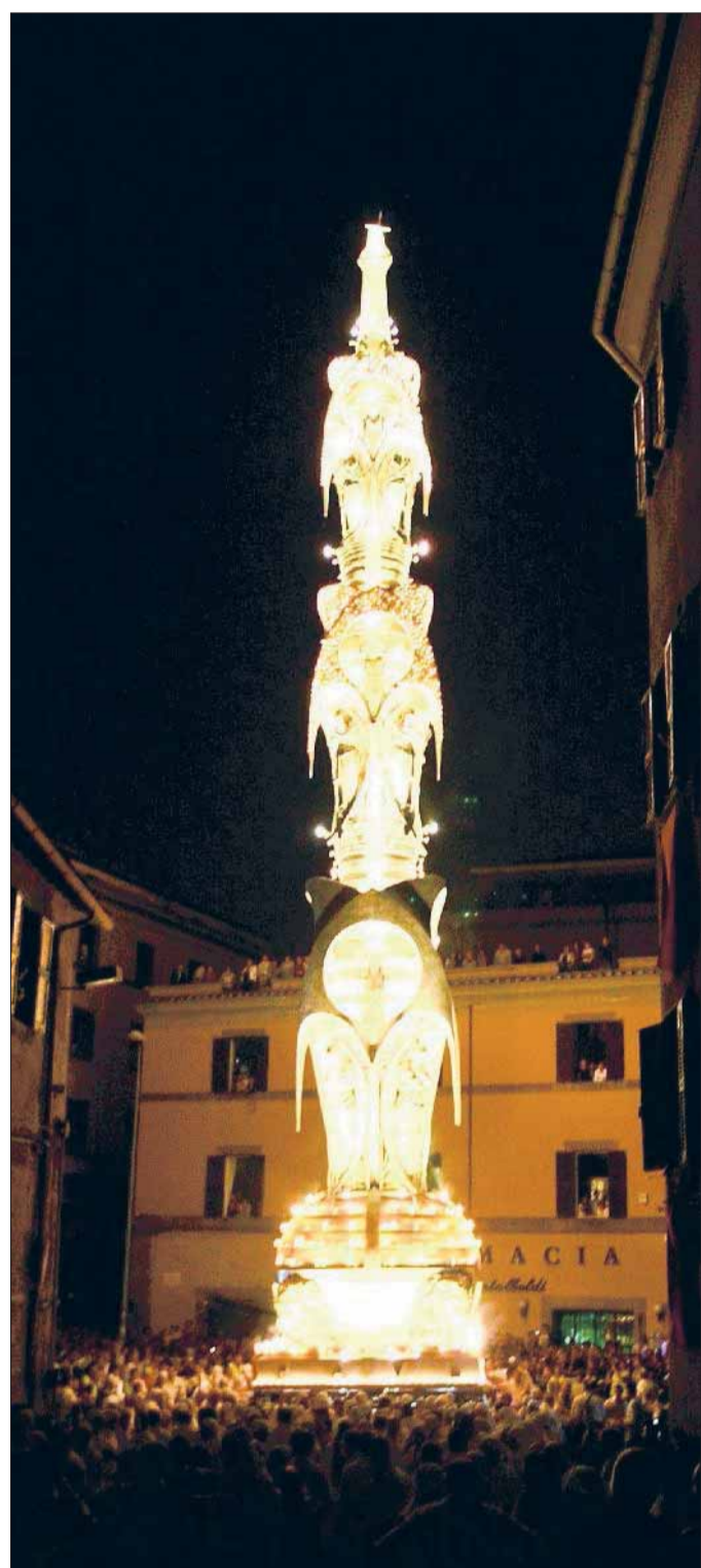
Ali di Luce Davvero trionfale il suo ultimo Trasporto

Furti in casa A Corchiano ora girano le ronde disarmate