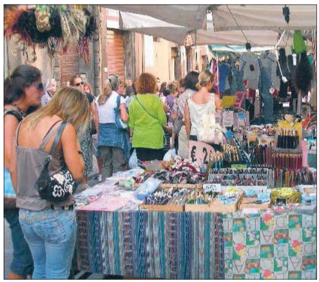
Fiera di S. Rosa Bancarelle affollate a caccia dell'occasione imperdibile ▶ A pagina 6

Tanta gente e gran caldo in centro Alla Fiera di Santa Rosa gli ultimi saldi estivi